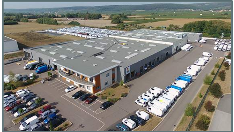
Site de production national SD Services à Gevrey-Chambertin (21)

Après la création en 1998 de l'unité de Longvic, un nouveau site voit le jour en 2012, à Gevrey-Chambertin, en Bourgogne. Sur près de 30 000m 2 au départ, cet exceptionnel outil de production s'agrandit quatre ans plus tard, pour atteindre 45 000m 2 et une capacité de stockage de 500 véhicules : équipes d'experts, usinage numérique, contrôle qualité, plateforme logistique, signature d'accords de péréquation avec les constructeurs automobiles,